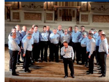
Coro La Baita