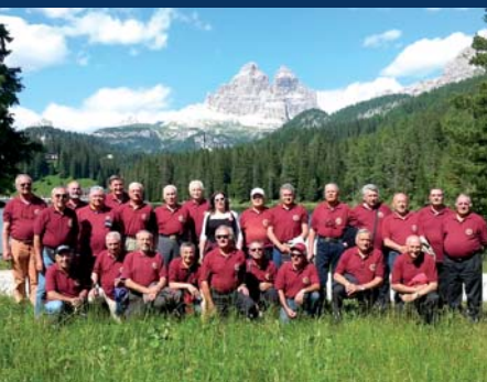
Coro CAI Mariotti