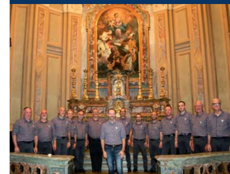
Coro Storie dai monti