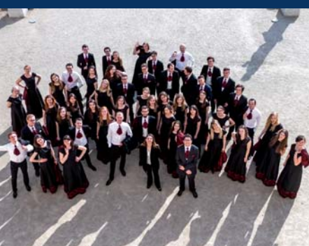
Choir of Medical University of Bialystok

Domenica 6 Maggio - ore 21 Casa della Musica, Sala dei Concerti ... col colore della gioventu'