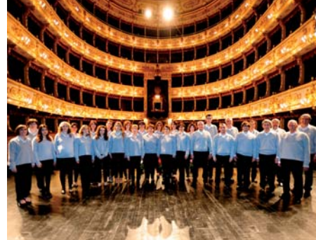
Coro Cantori delle Pievi