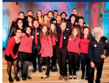
Coro Cor de' Vocali