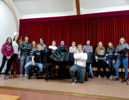
Coro giovanile Ars Canto