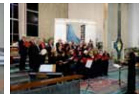
Coro Polifonico Ad Novas