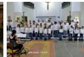
Coro scolastico InCoro