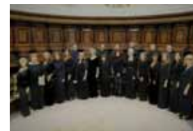
Coro Accademia Musicæesena